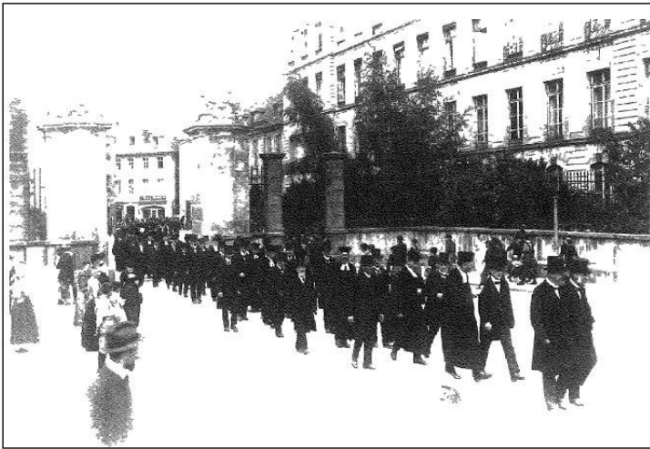
Generalsynode in Ansbach 1920